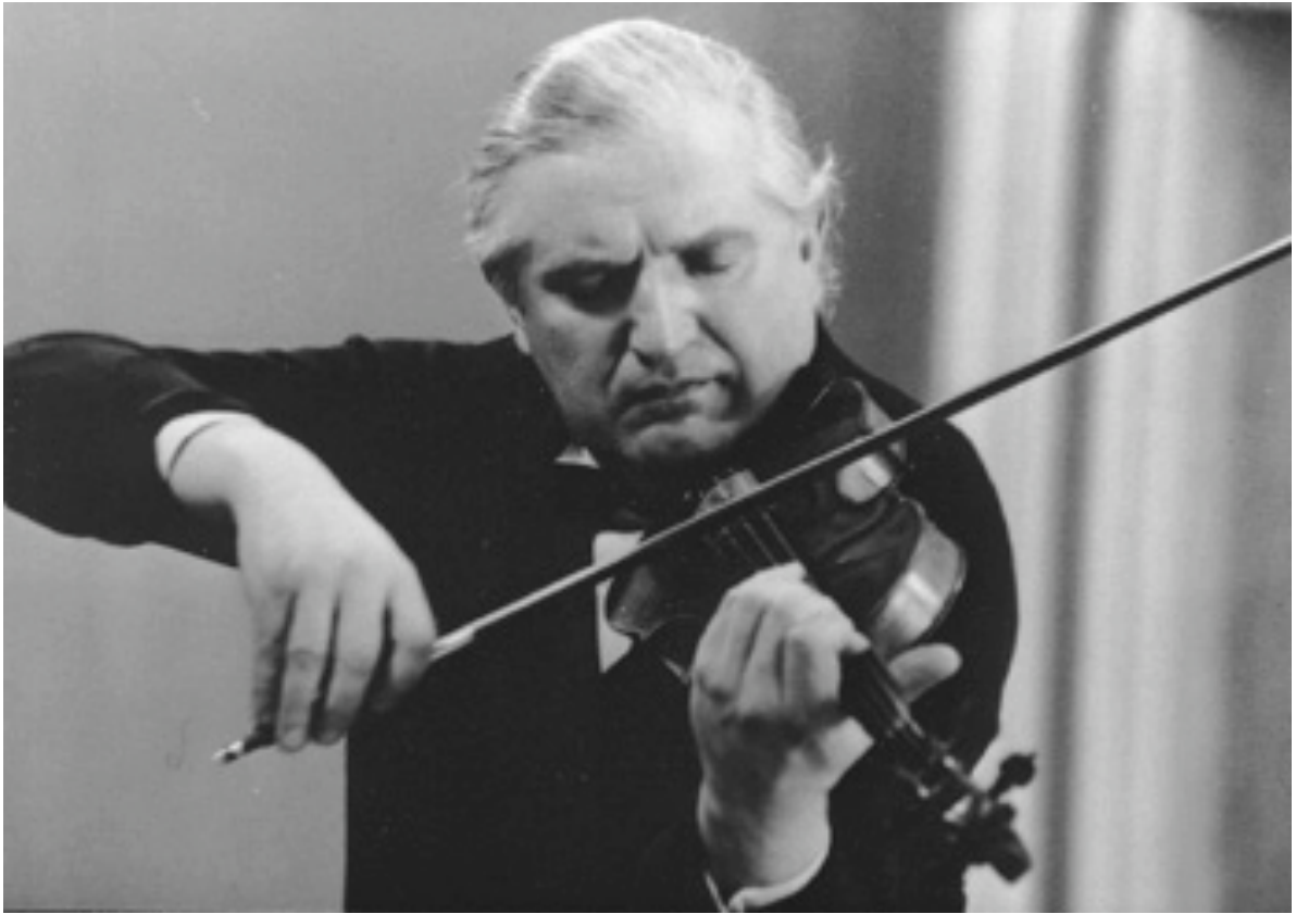
Tibor Varga 186