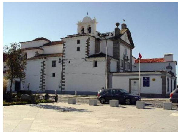
Convento dos Remédios

As EB1 do Bairro do Chafariz d'El-Rei, do Bairro da Câmara, da Avenida Heróis do Ultramar e do Bairro da Comenda , os Jardins de Infância do Bairro de Santo António e do Bairro Garcia de Resende e a Escola Básica Integrada de André de Resende estão localizados na Freguesia de Nossa Senhora da Saúde ( http://www.evora.net/senhoradasaude/historial.htm ).