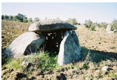
Anta do Viseu