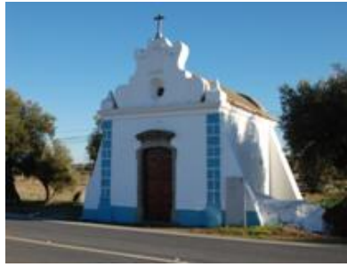
Ermida de Santa Bárbara do Degebe