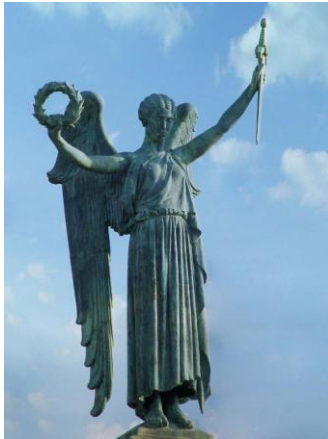
Monumento aos Mortos da Grande Guerra