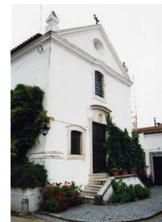
Capela de Nossa Senhora da Piedade