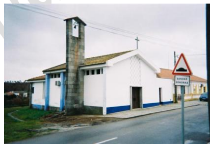
Capela da Vendinha