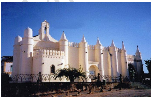
Ermida de São Brás

Do seu património arquitectónico referem-se a Ermida de São Brás , mandada construir por D. João II, o Chafariz do Rossio de São Brás , provavelmente mandado construir em 1592 por D. Filipe II, o Monumento aos Mortos da Grande Guerra e o Convento dos Remédios , onde actualmente está localizado o Conservatório Regional de Évora – Eborae Musica .