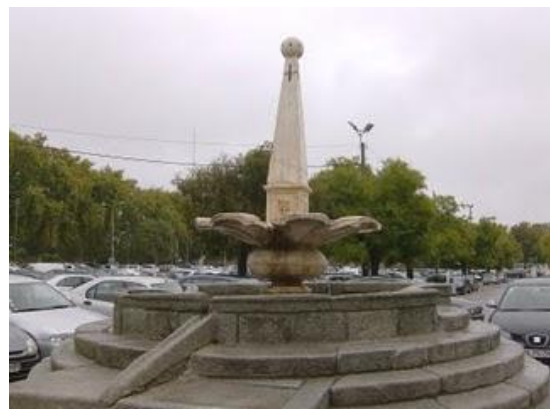
Chafariz do Rossio de São Brás