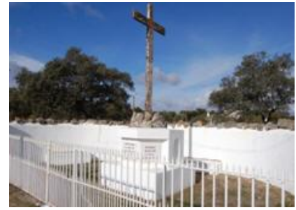
Cruzeiro de Degebe

São igualmente de realçar a Quinta do Sande (séc. XV) e a Quinta do Brigadeiro (séc. XVIII).