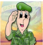
Yan Pimentel, n.º 21